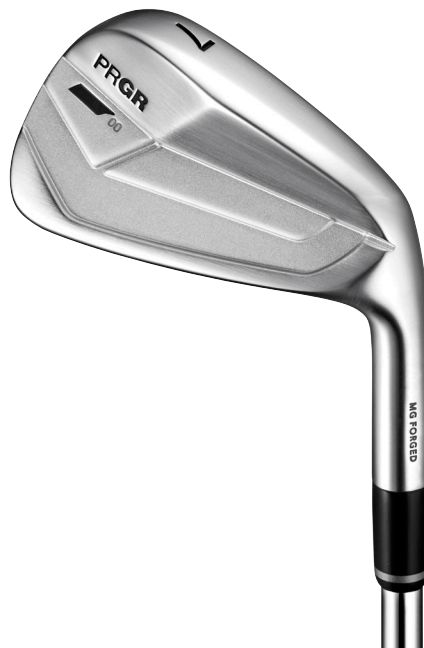
PRGR 00 IRON (#7)

「PRGR 00 IRON」は「PRGR IRONS」の中でも、最も小振りなヘッド設計でツアープロや上級者が好む形状と操作性を実現。さらに軟鉄鍛造1ピース構造の採用で気持ち良い打感に仕上げている。ヘッドは(株)三浦技研で一つ一つを高精度に製造し、設計通りのロフト、ライ、FPと理想的な重量フローを実現した純国産ツアースペックアイアンとなっている。